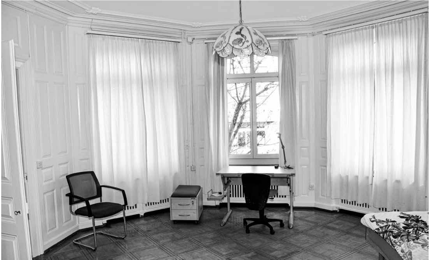
Turmzimmer mit Lavabo im Hochparterre