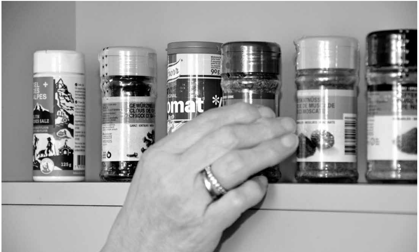
Gewürze, in Brailleschrift gekennzeichnet